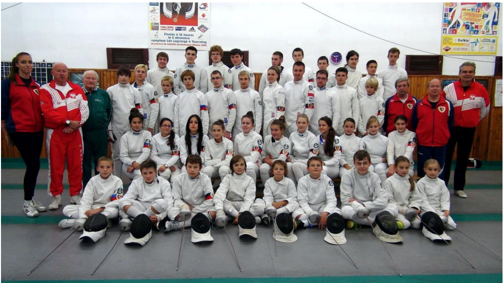
Sekcja Szermiercza GKS Piast – rok 2013