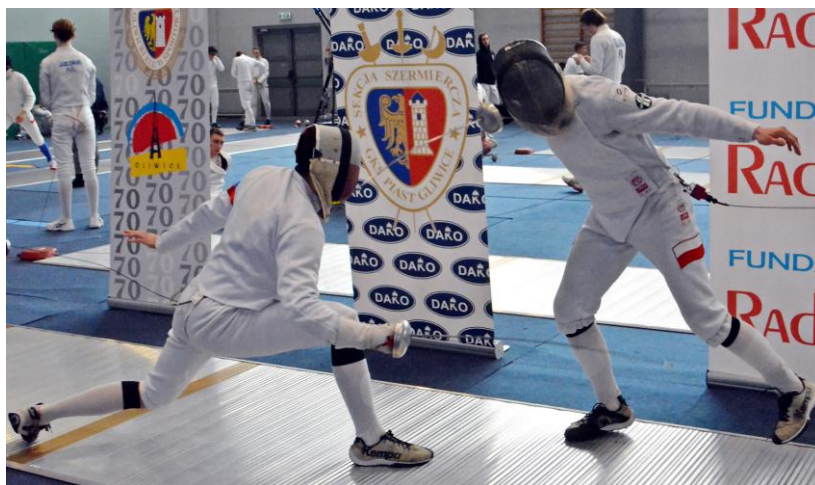
Sekcję Szermieczą Piasta Gliwice wspiera Miasto Gliwice