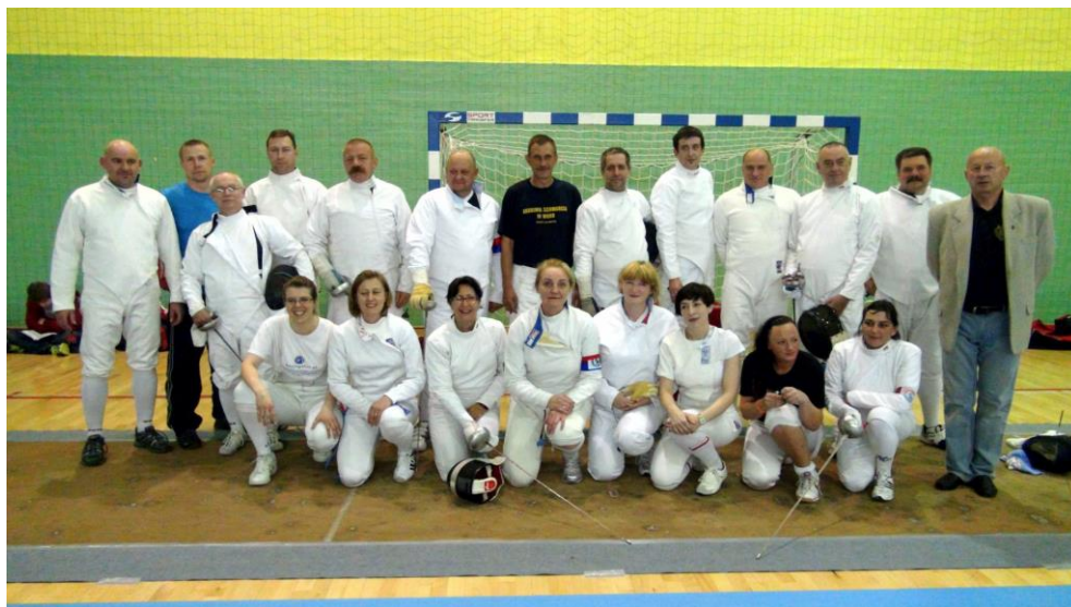
Sekcja Amatorów – GKS Piast Gliwice

Piast Gliwice słynie nie tylko ze szkolenia młodzieży. Od lat prężnie przy klubie działa sekcja amatorów, którzy określają siebie jako „Dinozaury”. Do tej ekipy może dołączyć każdy, który nie uprawiał profesjonalnie szermierki. Szpadzistki i szpadziści z tej grupy nie tylko regularnie trenują, ale też biorą udział w zawodach zarówno indywidualnych jak i drużynowych.