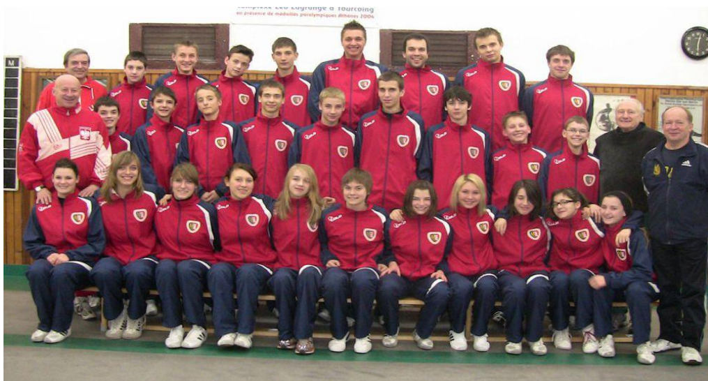
GKS Piast - Sekcja szermiercza – rok 2009

Na rozgrywanych pod koniec kwietnia mistrzostwach Polski Ruben Limardo, Wenezuelczyk broniący barw Piasta wywalczył złoty medal w turnieju indywidualnym, a drużyna zdobyła srebrny krążek.