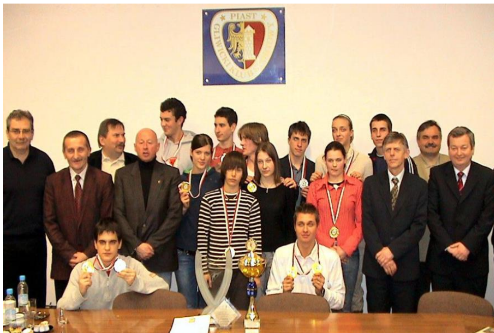
Rok 2007 – Działacze, trenerzy i wyróżniające się zawodniczki i zawodnicy sekcji szermierczej Piasta Gliwice