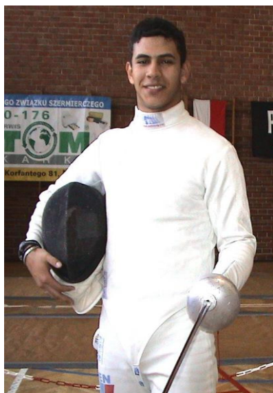
Ruben Limardo – Mistrz Polski oraz Mistrz Olimpijski 2012