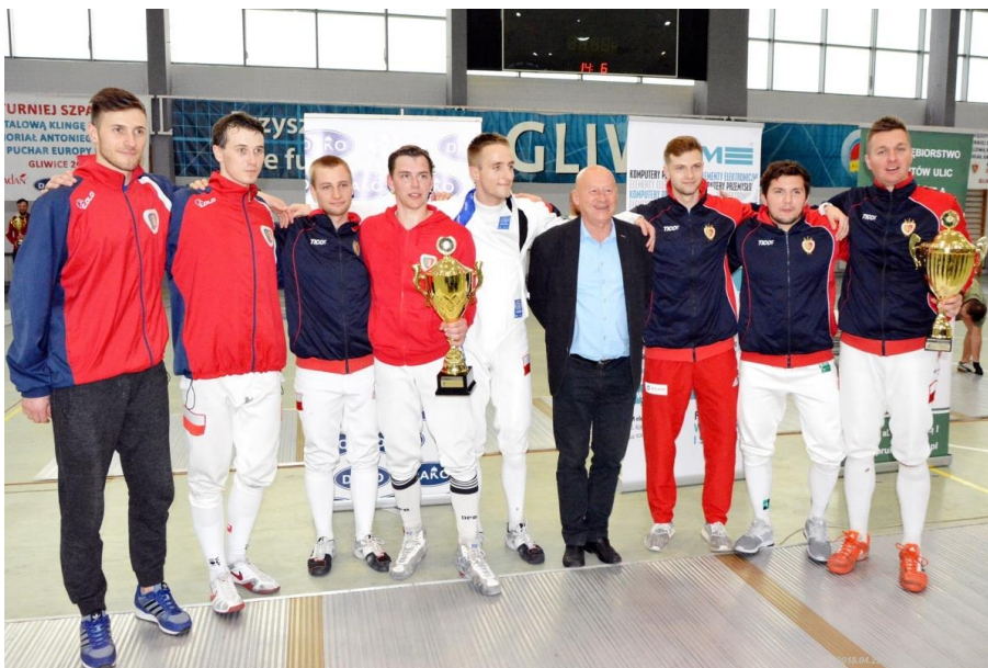
Memoriał Antoniego Franza – rok 2019