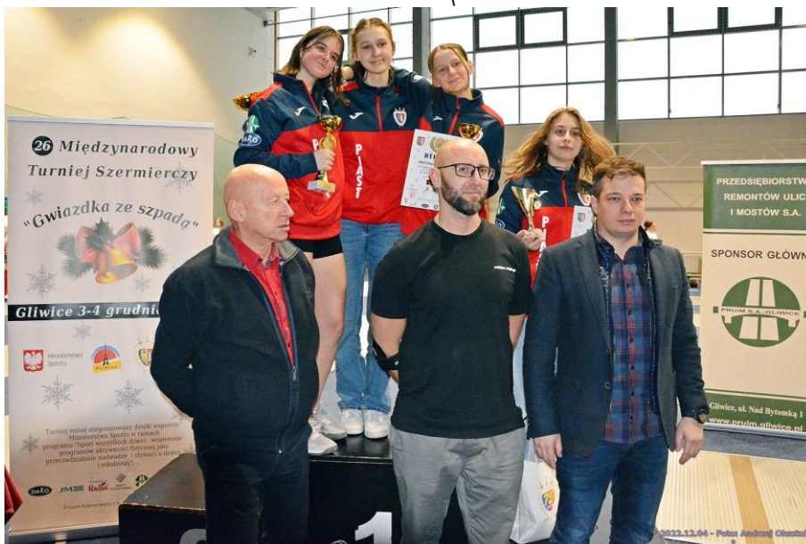
Gwiazdka ze Szpadą