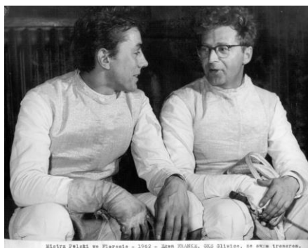
Mistrz świata we florecie – 1962 – Egon FRANKE, z jego trenerem, Zbigniewem CZAJKOWSKIM