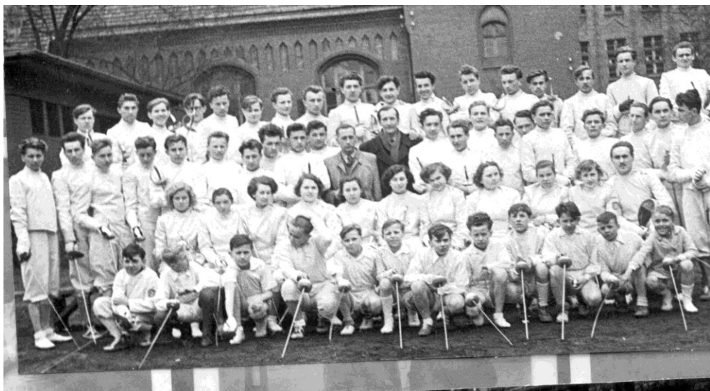
Piast Gliwice – sekcja szermiercza rok 1955