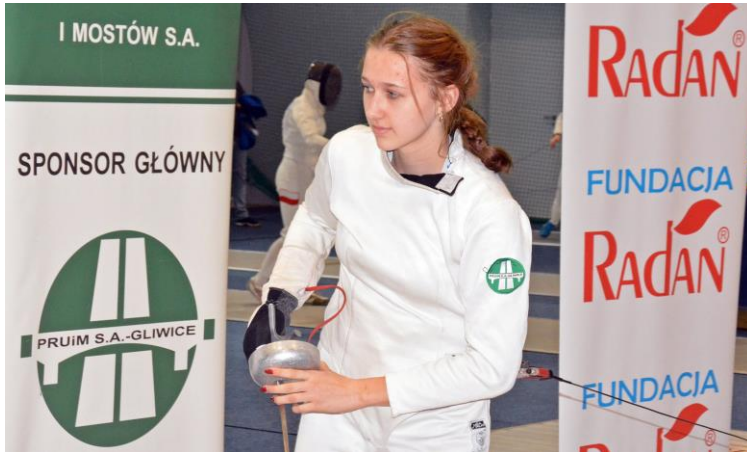
Sekcję szermierczą Piasta Gliwice wspiera PRUIM S.A. Gliwice